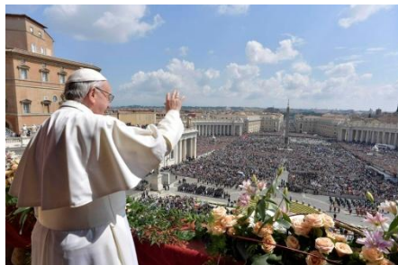
Papa no Vaticano